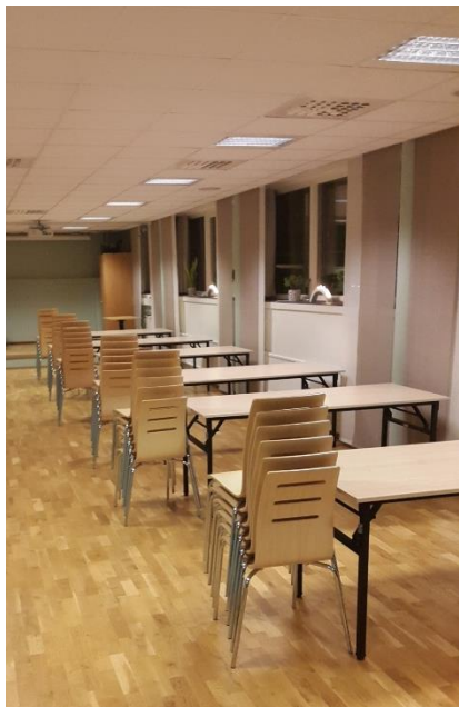
Uppställning av bord och stolar efter uthyrningen.