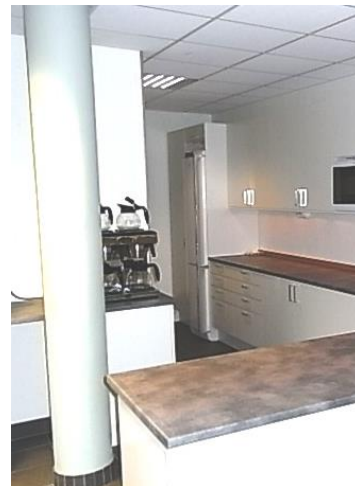
Kök med serveringsbänk och utrustat med spis, kyl- och frys, mikrovågsugn, kaffebryggare samt diskmaskin