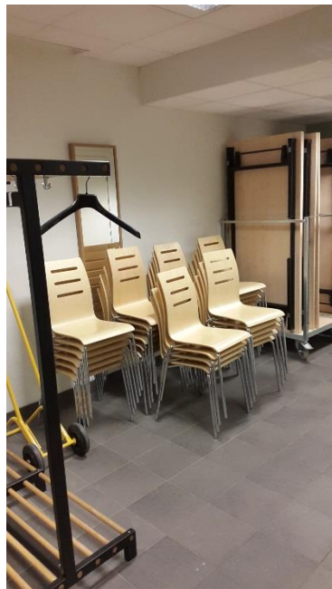
Extra bord och stolar finns i kapprummet utanför toaletterna.