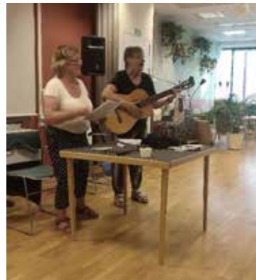
Medlemsmöte 6 september