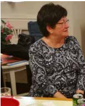
Dart 10 september