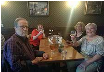
Restaurangkväll på Tre Bröder 20 september