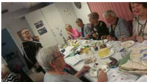
Surströmming 27 september