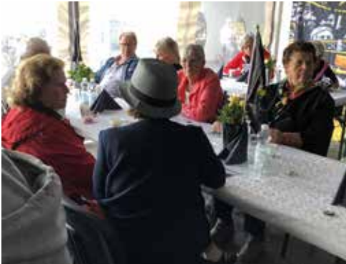
Friends Arena 26 augusti