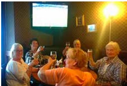
Restaurangkväll på Tre Bröder 20 september