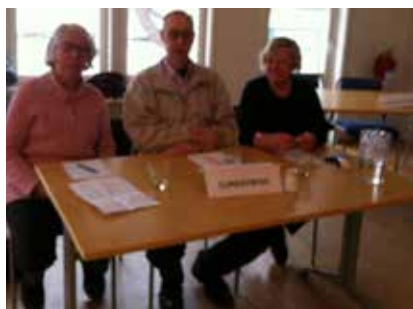
Våra representanter i Veteranvetartävlingen