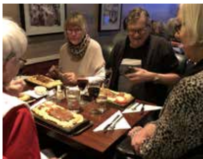
Restaurangbesök på Alex Bar