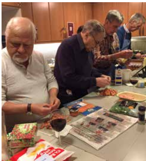
Matlagning för herrar