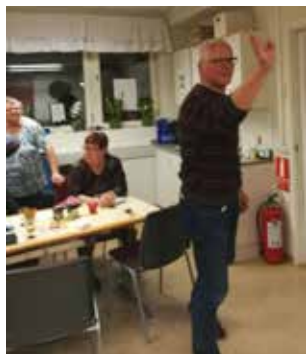
Dart 13 november