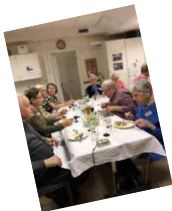
Jubileumsfest 30 november