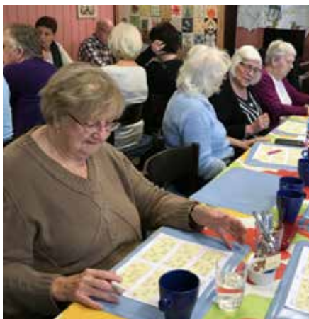
Bingo hösten 2017