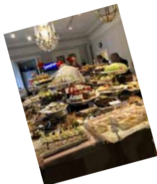
Julbordsresa 24 november