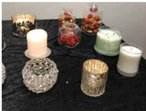
Ljusparty 20 november