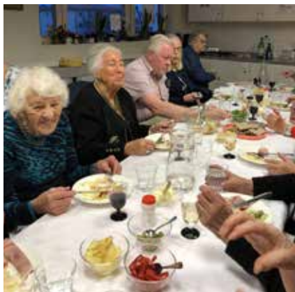
PUB afton 9 november