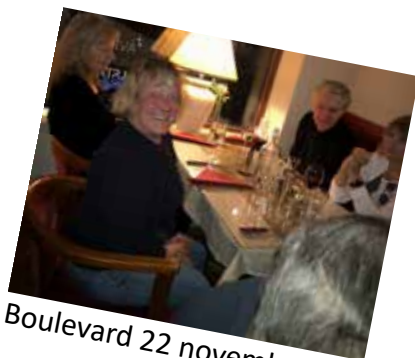
Boulevard 22 november