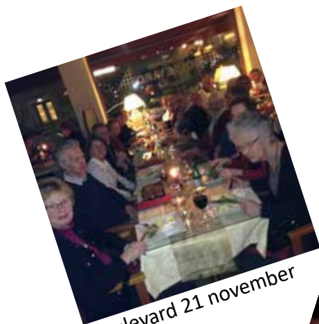
Boulevard 21 november