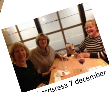
Julbordsresa 7 december