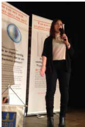
Medlemsmöte 6 december

Sundbybergs stadsnät och Äldreförvaltningens myndighetsenhet informerade.