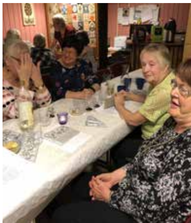
PUB afton 8 november