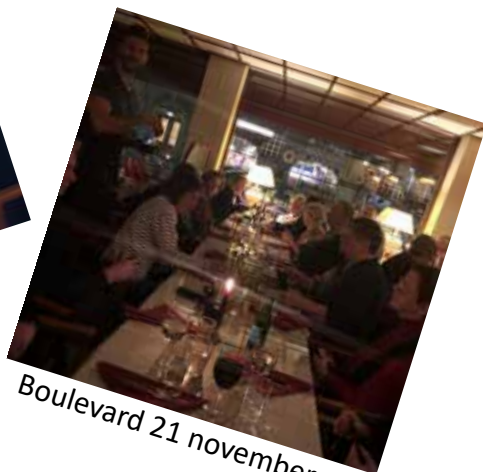
Boulevard 21 november