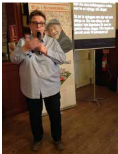
Medlemsmöte 6 december

Sundbybergs stadsnät och Äldreförvaltningens myndighetsenhet informerade.