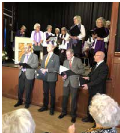
Medlemsmöte 1 november