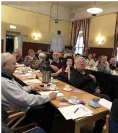
Årsmöte 7 mars