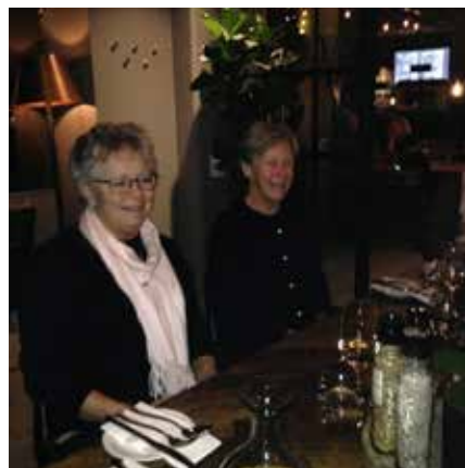
Restarangkväll på Eatery