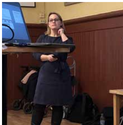
Medlemsmöte 7 februari