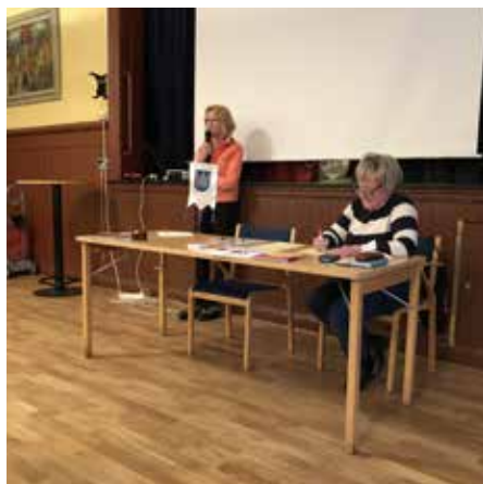
Medlemsmöte 7 februari