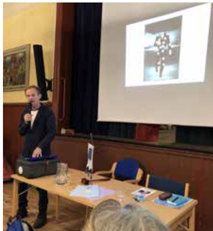
Årsmöte 7 mars