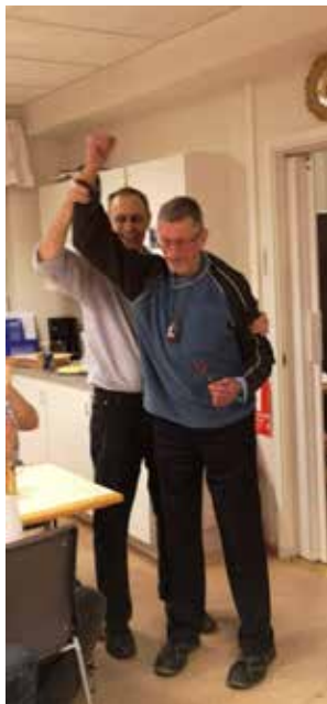
Kvällens vinnare Dart 30 januari