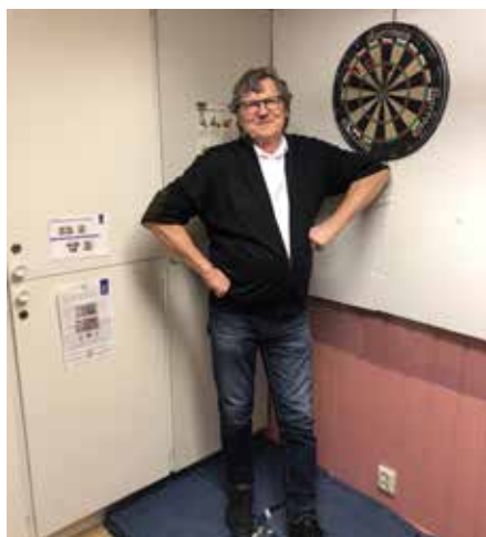
Kvällens vinnare Dart 13 mars