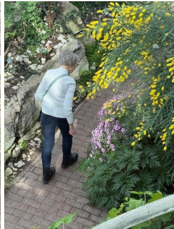
Siw med vackra blomster

Vi avslutade dagen med Thaibuffé på Vasagatan innan vi trötta och nöjda efter en lång dag återvände till Nykvarn.