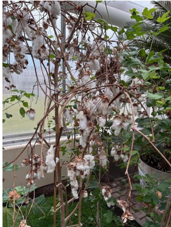
Bomullen var redo att skördas