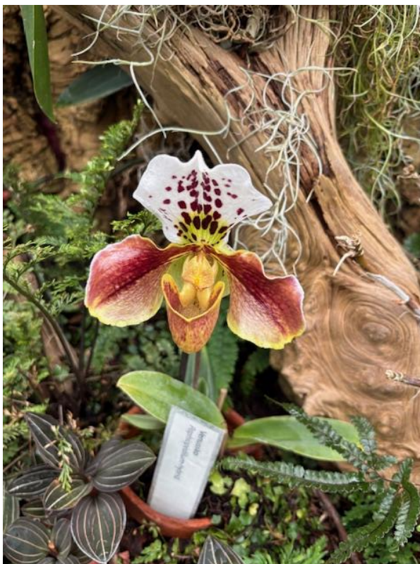
En köttätande Venussko