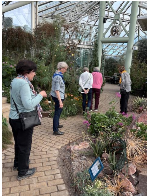
Några betraktar de vackra och sällsynta växterna i all sin prakt