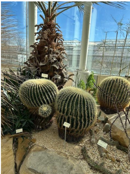
Svärmorskuddarna trivs i värmen