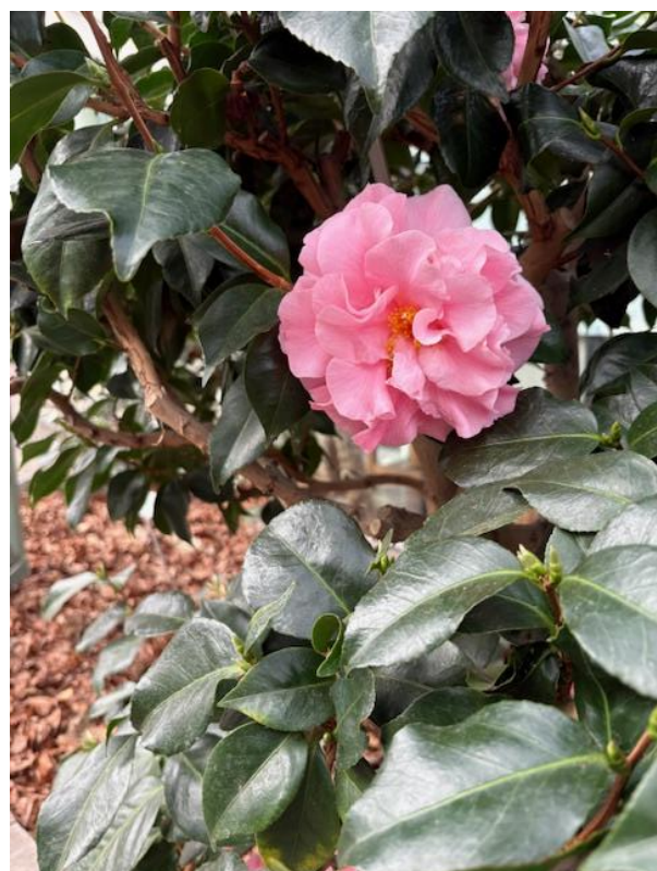
En vacker Kamelia