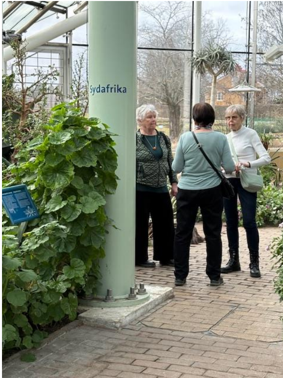
Sammanträde i en annan världsdel