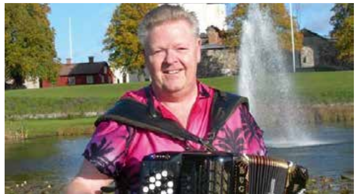
Den 23 april spelar Glade Glenn

Varmt välkomna ! Intresseföreningen Pomona