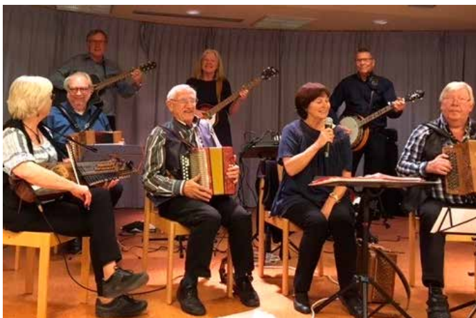
Den 4 juni spelar Durlaget