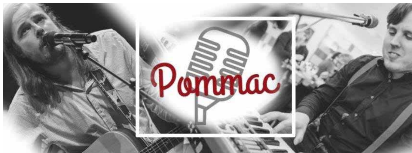
Torsdagen den 7 maj Pommac Duo

GLÖM INTE AVBOKA DIG OM DU FÅR FÖRHINDER!