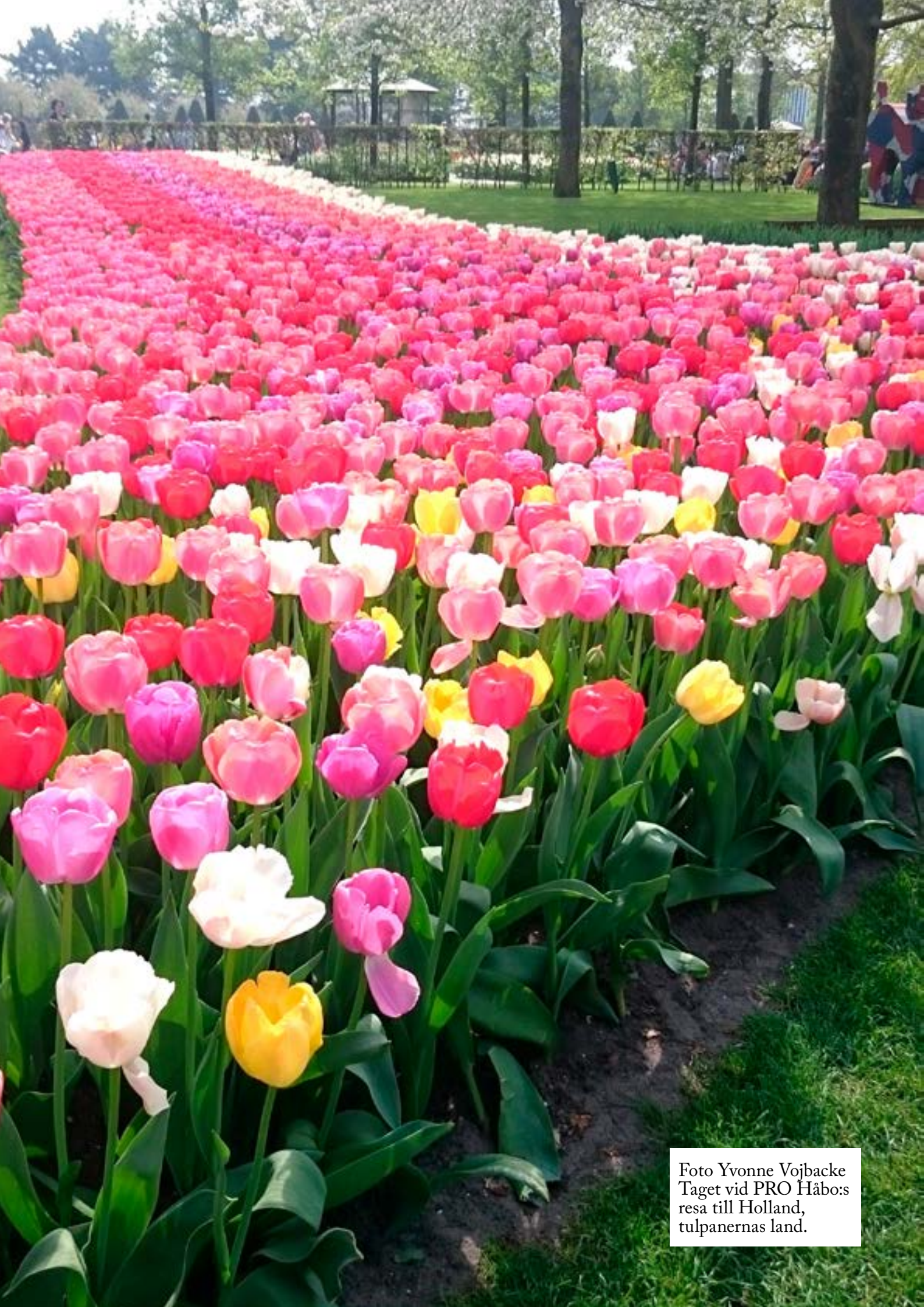
Taget vid PRO Häbos resa till Holland, tulpanernas land.