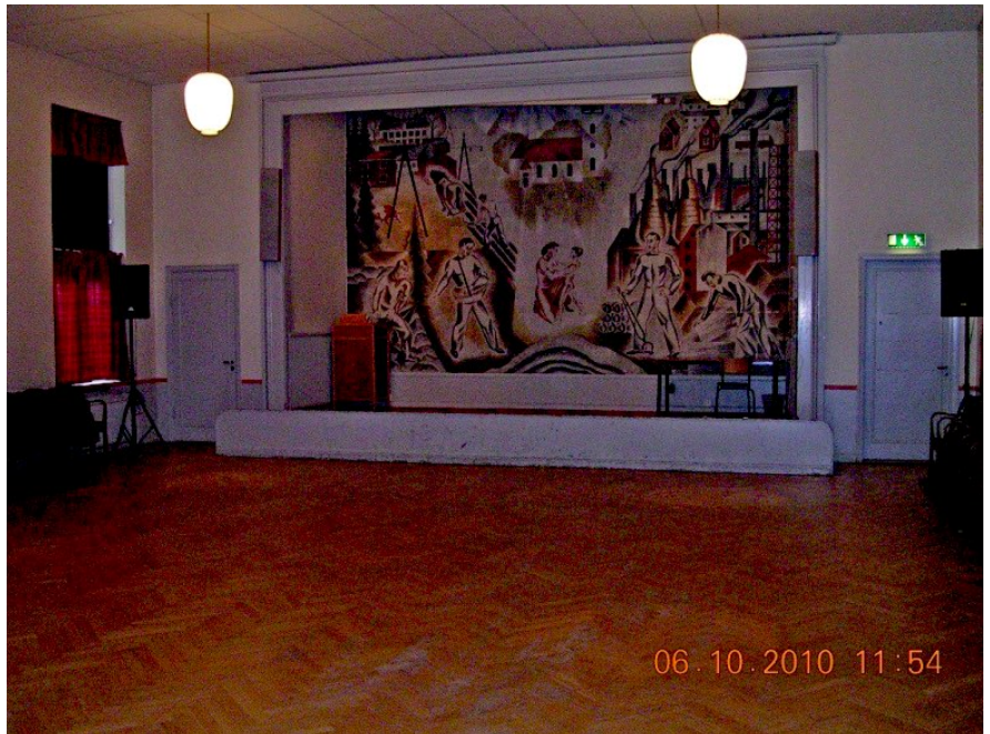
Stora möteslokalen i Kommunhuset

Som tur var fanns Kommunhuset med en stor samlingslokal att tillgå för mötesverksamheten. Där höll det nybildade PRO Valbo sina föreningsmöten, som i dag kallas medlemsmöten.