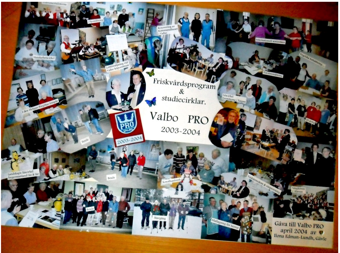
Bilden ovan är en tavla sammansatt av bilder från friskvårds- och studieverksamheten år 2003 – 2004. Tavlan har skänkts till PRO Valbo av Ilona Edman-Lundh som fotograferat och utfört montaget.