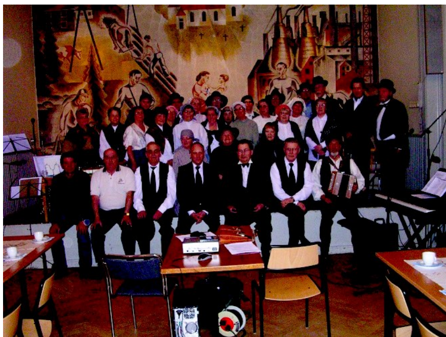
Hela ensemblen som medverkade i framförandet av "Mackmyrakonflikten 1906"