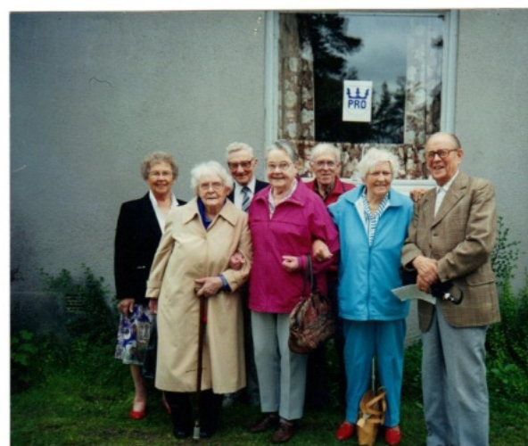
Utanför PRO-lokalen i Valbo Centrum, 1994

Arbetet med ombyggnader och renovering har