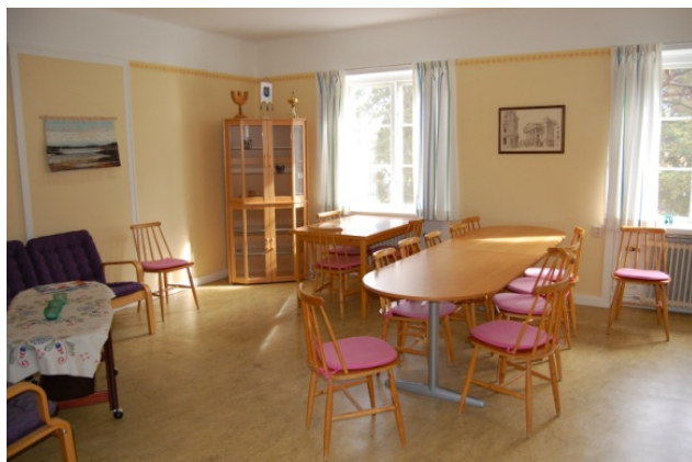
Möteslokalen övre våningen, 2009