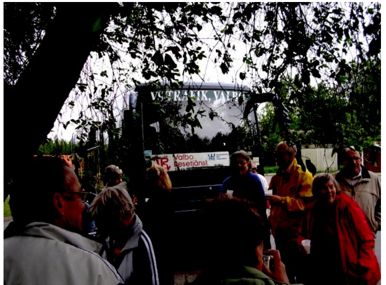
Kafferast på väg hem från Polen 2007

Endagsresor har i stor utsträckning haft resmål inom Gästrikland, Hälsingland, angränsande landskap och till Stockholm. Resmålen har varierat t ex teaterföreställningar, musicaler, danstillställningar, djurparker, Skansen och dagsutflykter t ex till Gysinge folkhögskola, Hälsingland runt, Siljan runt med sevärdheter av olika slag. Mystisk eller hemlig resa var tidigare ett återkommande inslag.