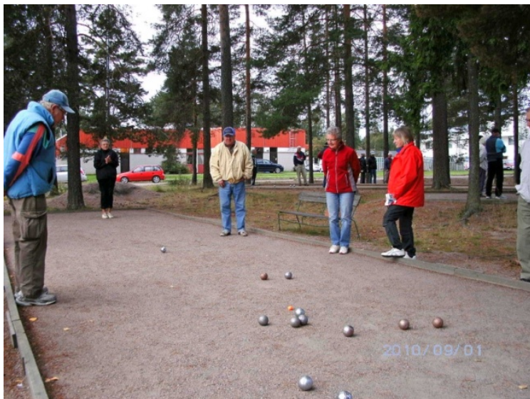
Boulespel på föreningens banor i Valbo

Motion i form av boule, lättgymnastik, stavgång, bordtennis, Qi-Gong och styrketräning samlar numera många utövare .