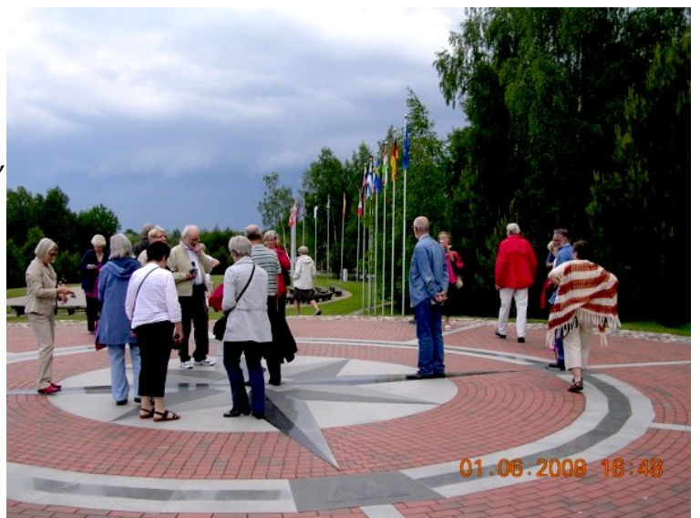
På Europas geografiska mittpunkt utanför Vilnius, Litauen

Tvådagarsresor har i stor utsträckning företagits till Åland. På dessa resor har nog det mest lockande varit vad båten kunnat erbjuda i form av mat, dryck och underhållning till ett bra pris. De längre resorna på tre till fyra dagar har företagits till landskap på lite längre avstånd t ex Skåne, Bohuslän, Lappland, Blekinge och Öland, Gotland, Ångermanland, Värmland, Jämtland, Inlandsbanan m fl. Resorna har i regel föregåtts av studiecirkel om det landskap som senare besökts.