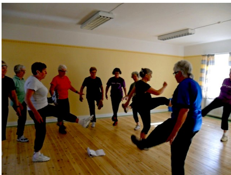
Lättgymnastik i stora salen, övervåningen

Stavgång utförs mera individuellt eller i mindre grupper. Promenader och cykling förekommer fortfarande som motionsform.