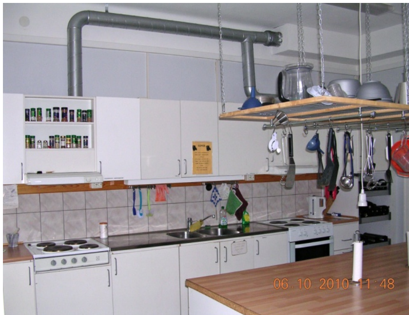
PRO Valbos kök

Det är alltid trevligt när våra "egna"- sångkören C-klaven och