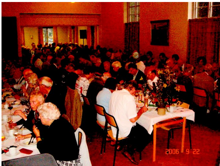
PRO Valbo firar 35-årsjubileum i Kommunhuset med 165 deltagare

Bildspelet hade föregåtts av en studiecirkel vars medlemmar ville dela med sig av sina kunskaper om konflikten genom att i tidsenliga kläder visa upp ett bildspel med bilder från den aktuella tiden med berättelser, musik, tal och sång. God hjälp vid bildspelets uppsättning och framförande hade ensemblen av konsulenten vid Folkteatern Björn Skjefstad. Förutom cirkeldeltagarna deltog sångkören C-klaven och Instrumentalisterna . Bildspelet uppfördes även vid flera andra tillfällen – bl a för allmänheten i Valbo, för lärare och elever vid Sofiedalskolan, vid LO-distriktets manifestation av 100-årsminnet av konflikten och vid SAP:s A-dagar på Scandic Hotel Väst.