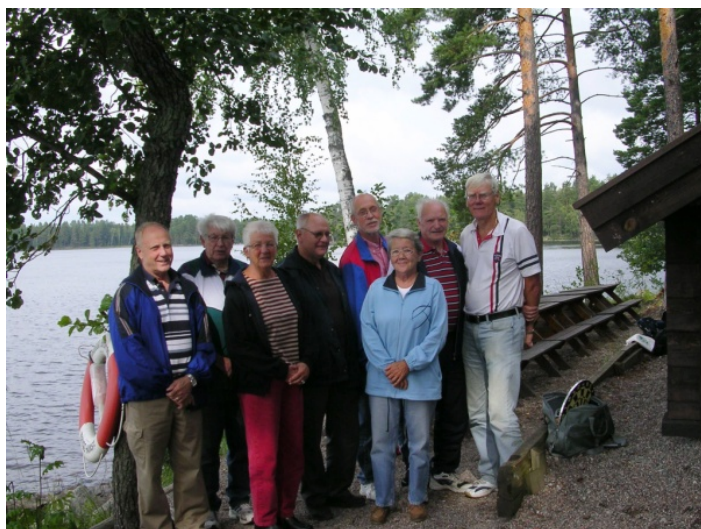
Styrelsen sammanträdde vid Öjaren i augusti 2006