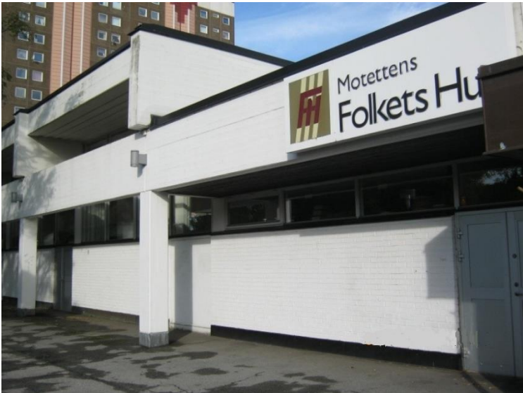
Motettens Folkets Hus, Munkhättegatan 202, Malmö