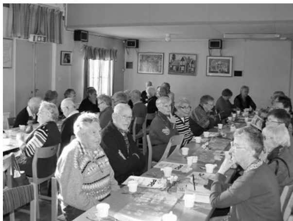
Förväntansfulla medlemmar inför årsmötet den 17 februari 2012.