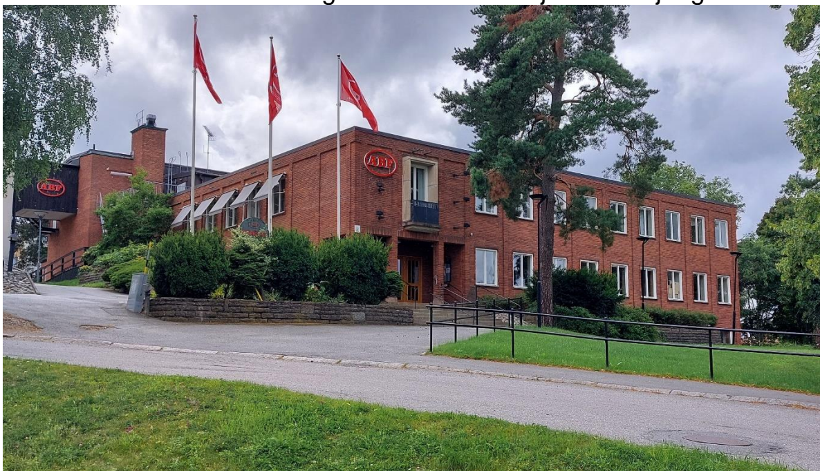
ABF-huset