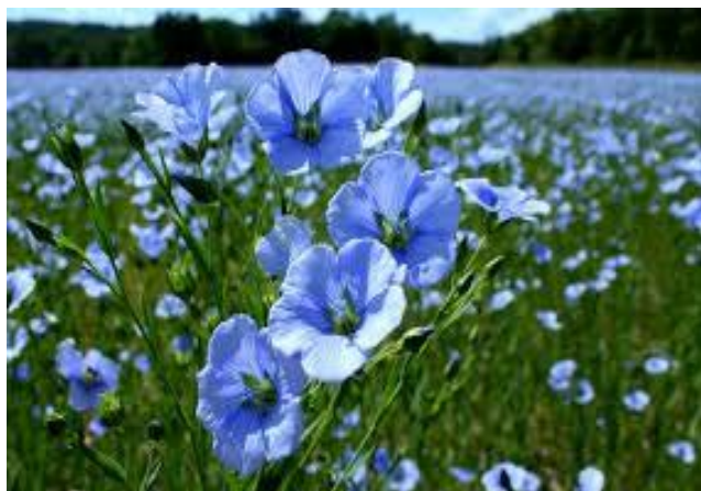
Hälsinglands landskapsblomma lin