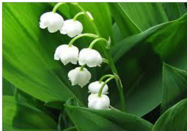
Gästriklands landskapsblomma är liljekonvalj