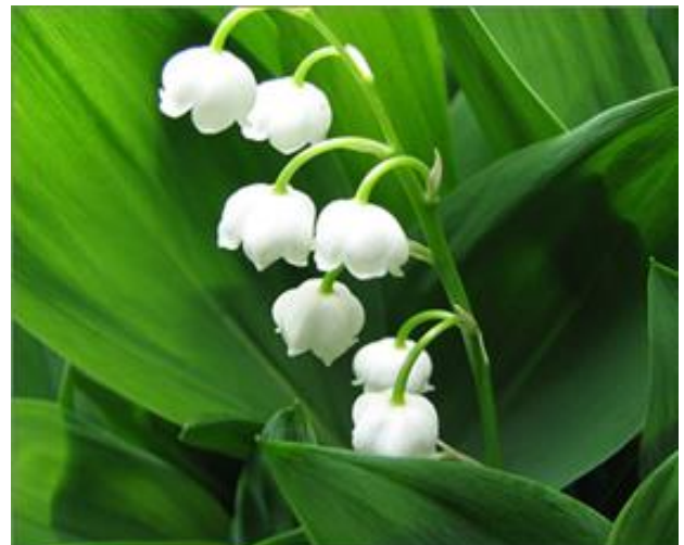
Gästriklands landskapsblomma Liljekonvalj