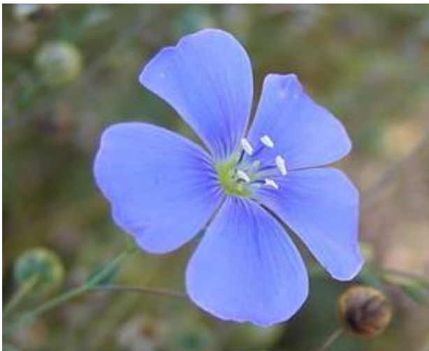
Hälsinglands landskapsblomma Lin