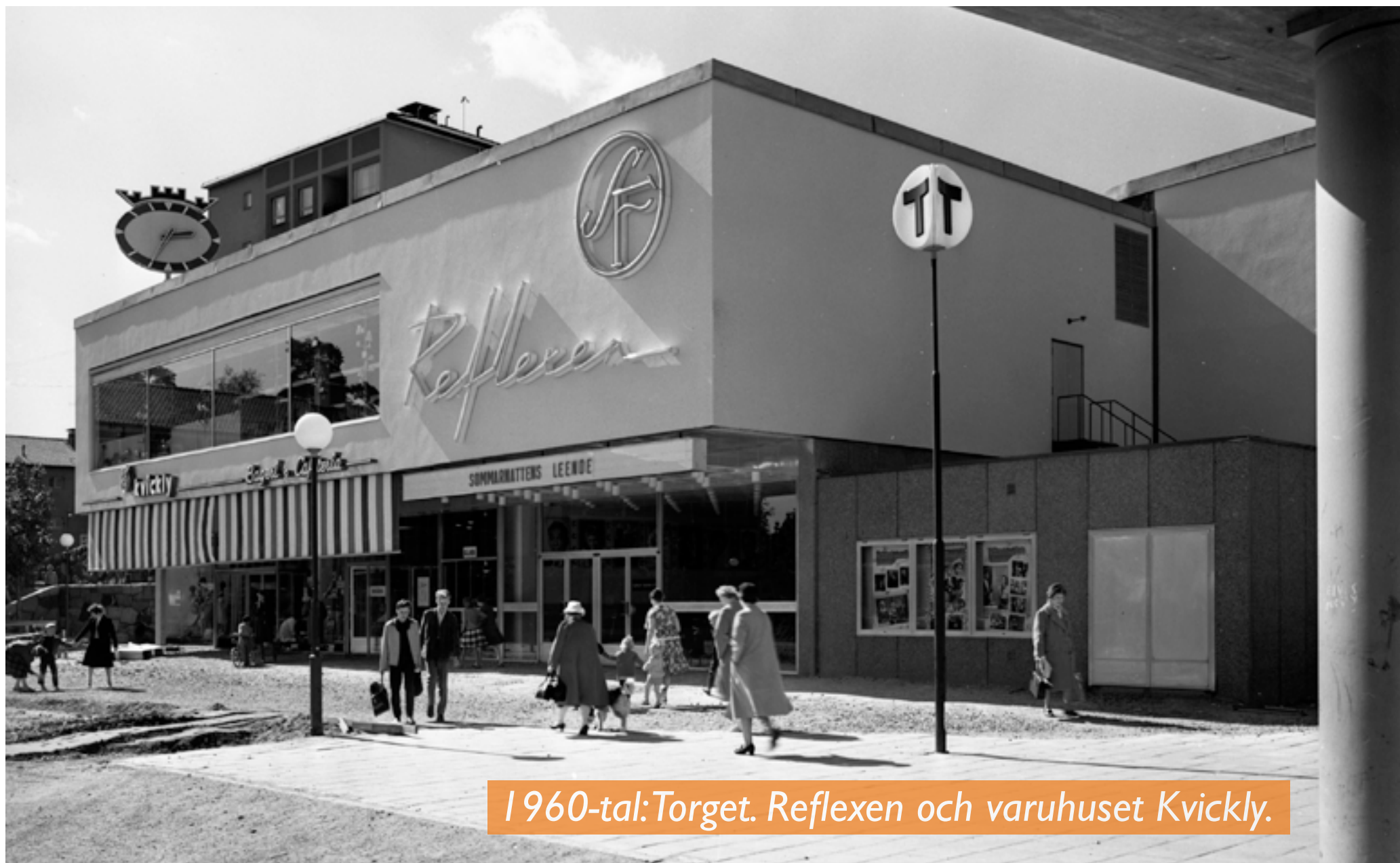
1960-tal: Torget. Reflexen och varuhuset Kvickly.