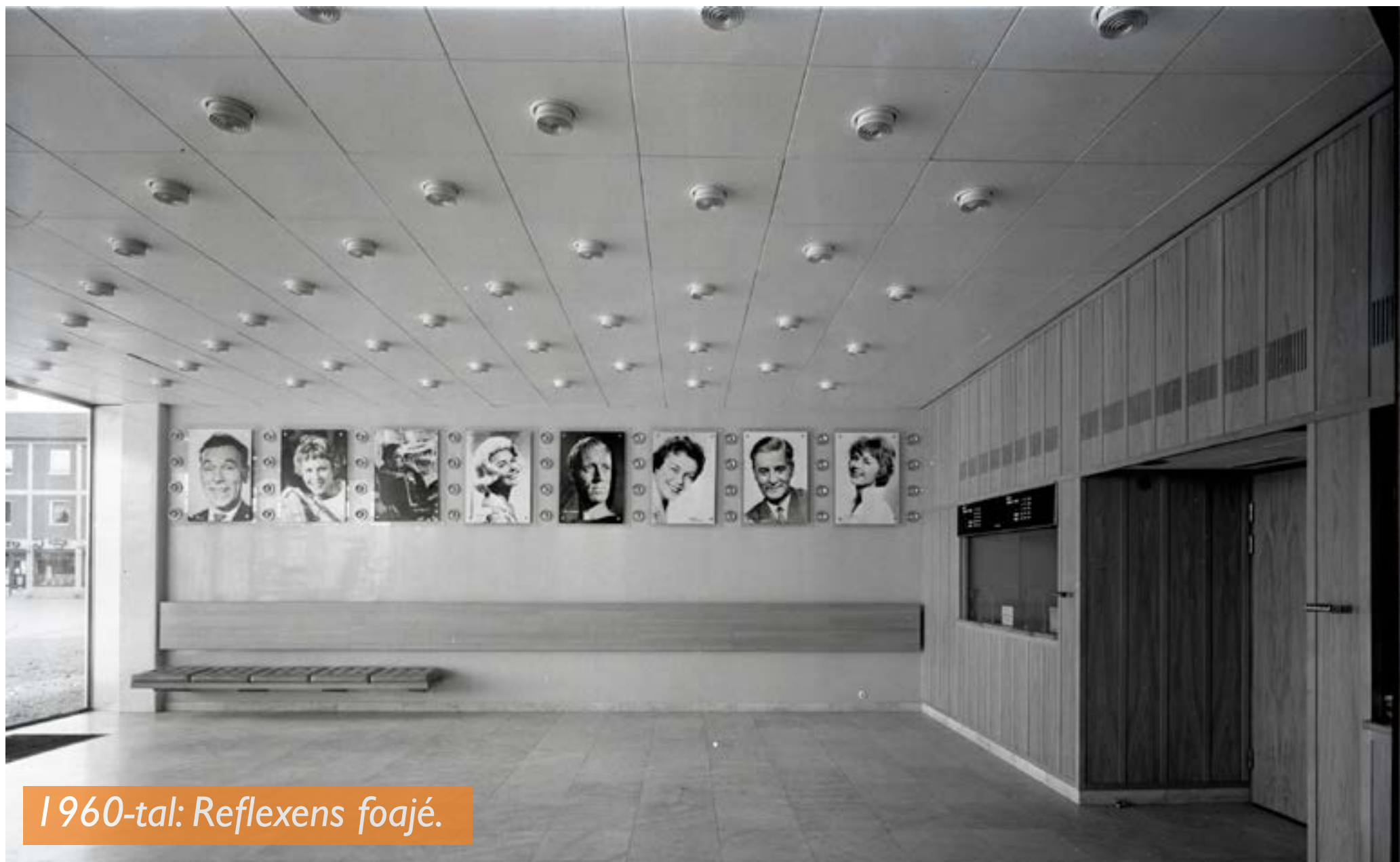
1960-tal: Reflexens foajé.