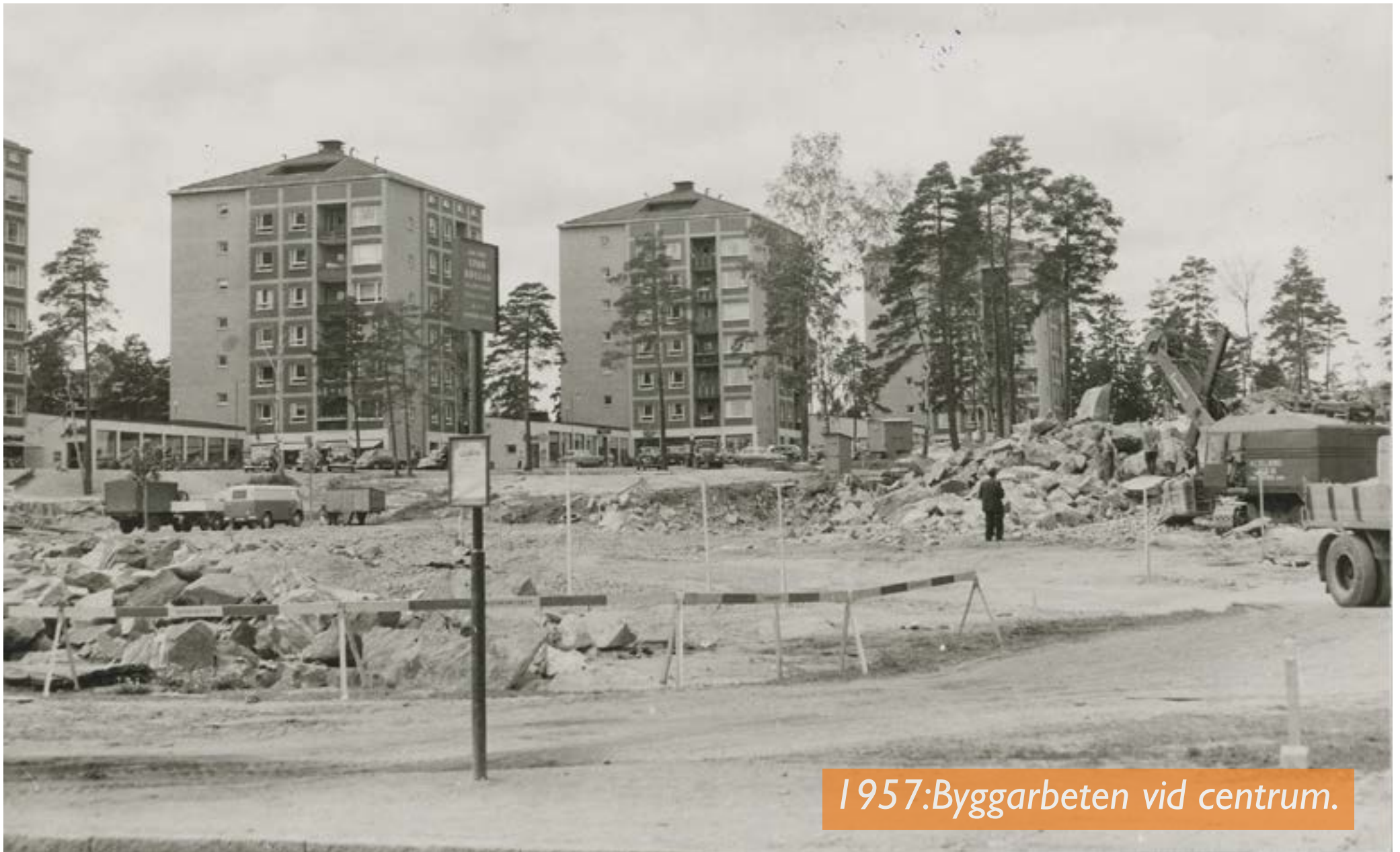
1957:Byggarbeten vid centrum.