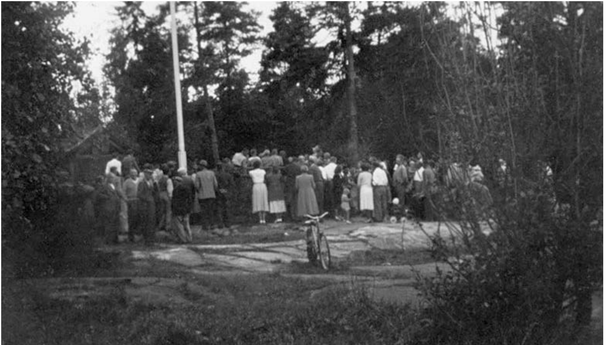
1949: Folk vid dansbanan i koloniområdet.