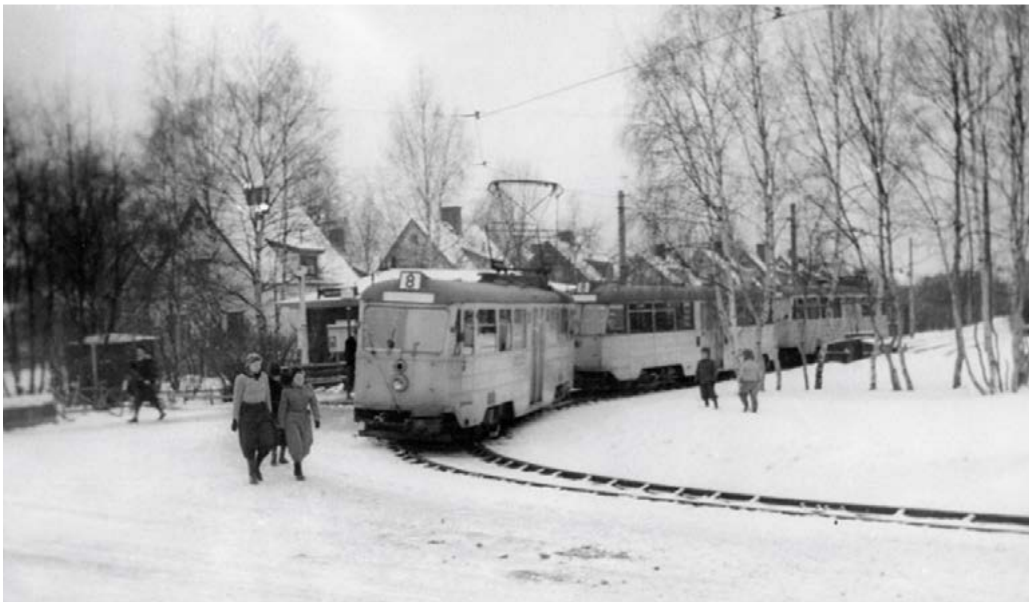
1949: Spårvagnens vändplan.