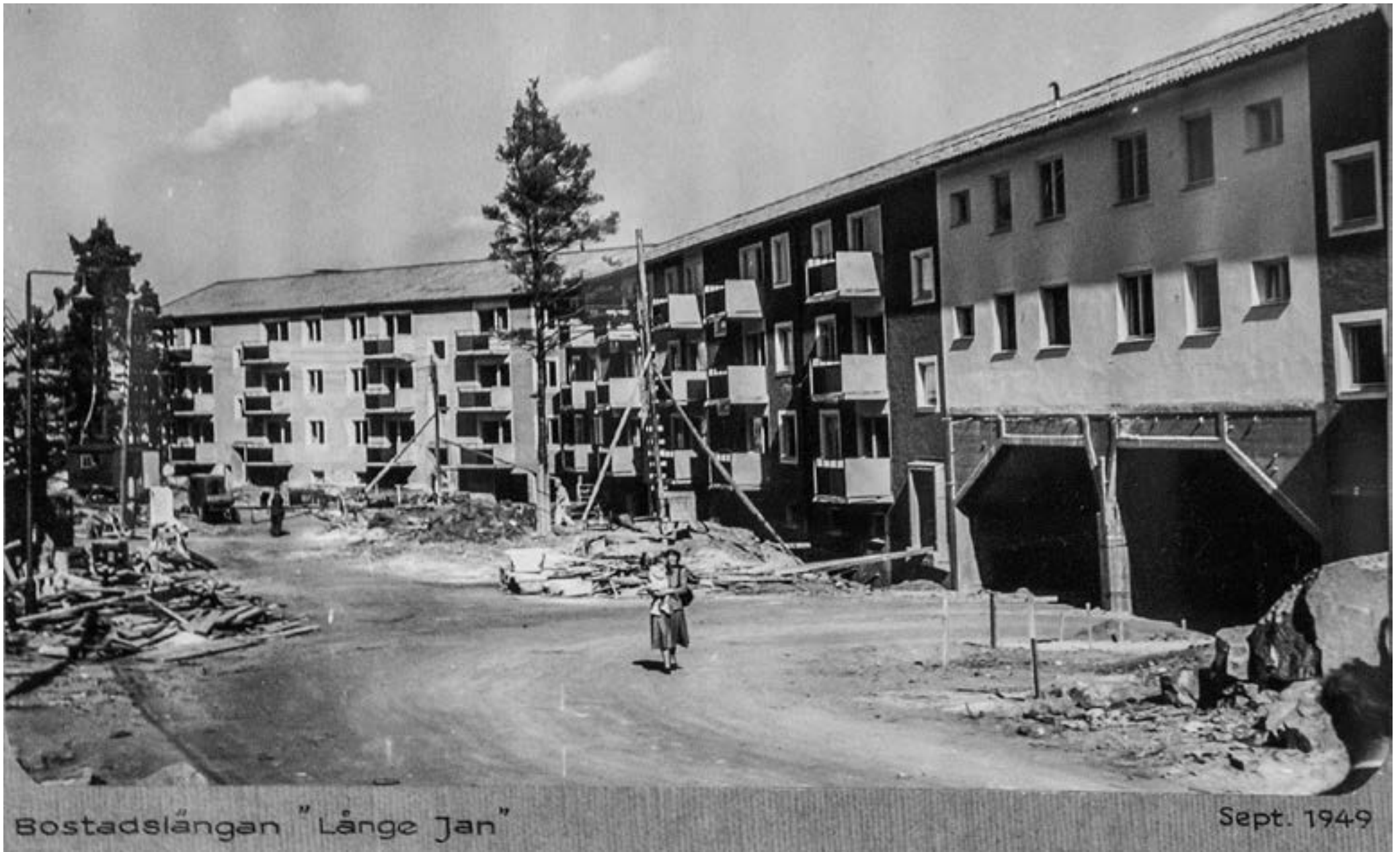
Bostadslängan "Länge Jan"