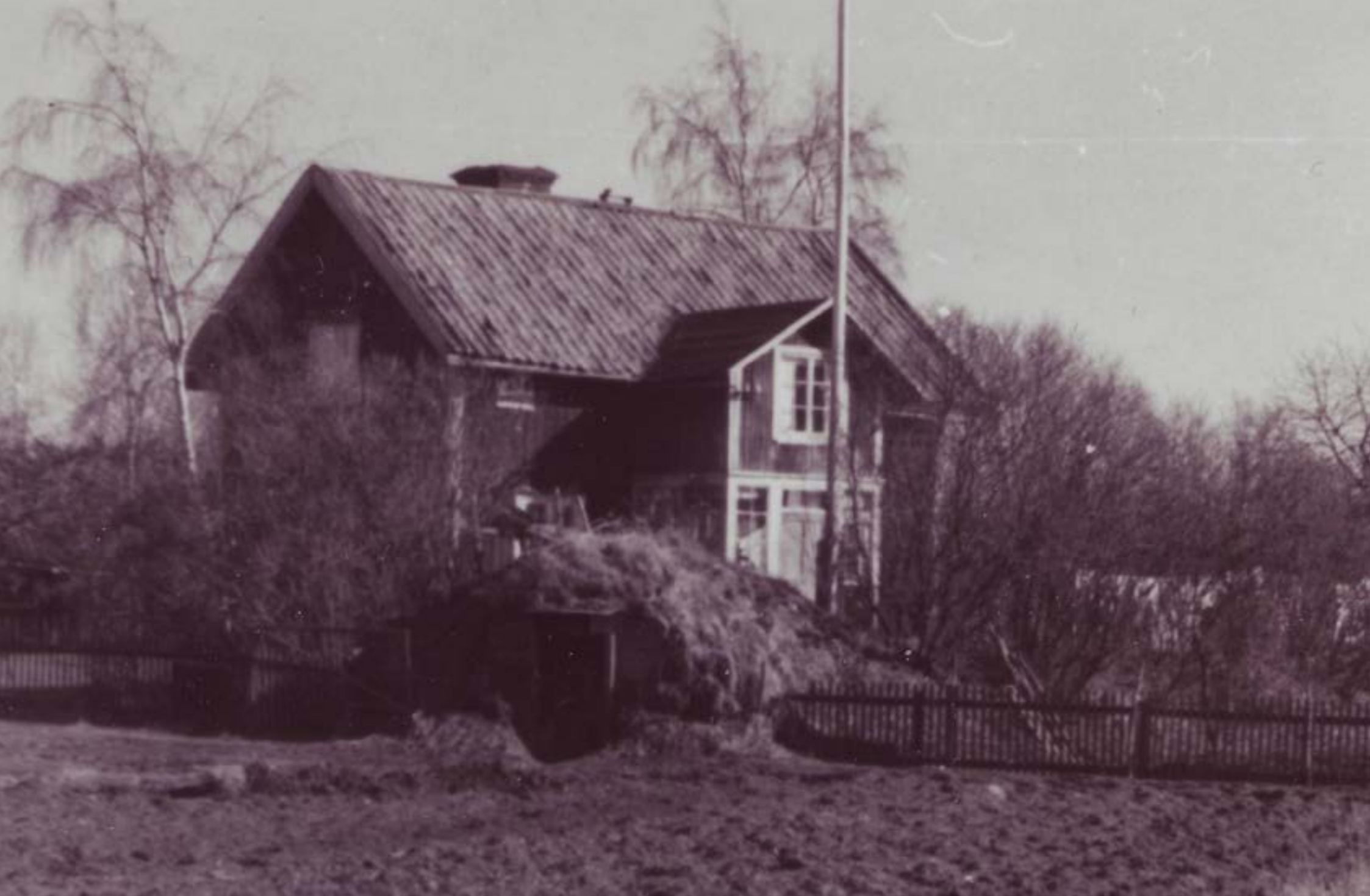
Nytorpet (rivet för badet 1961).