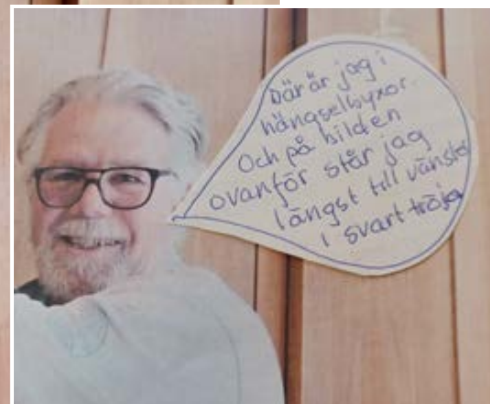
2022: Fotoutställning till Kärrtorps 70-årsjubileum.