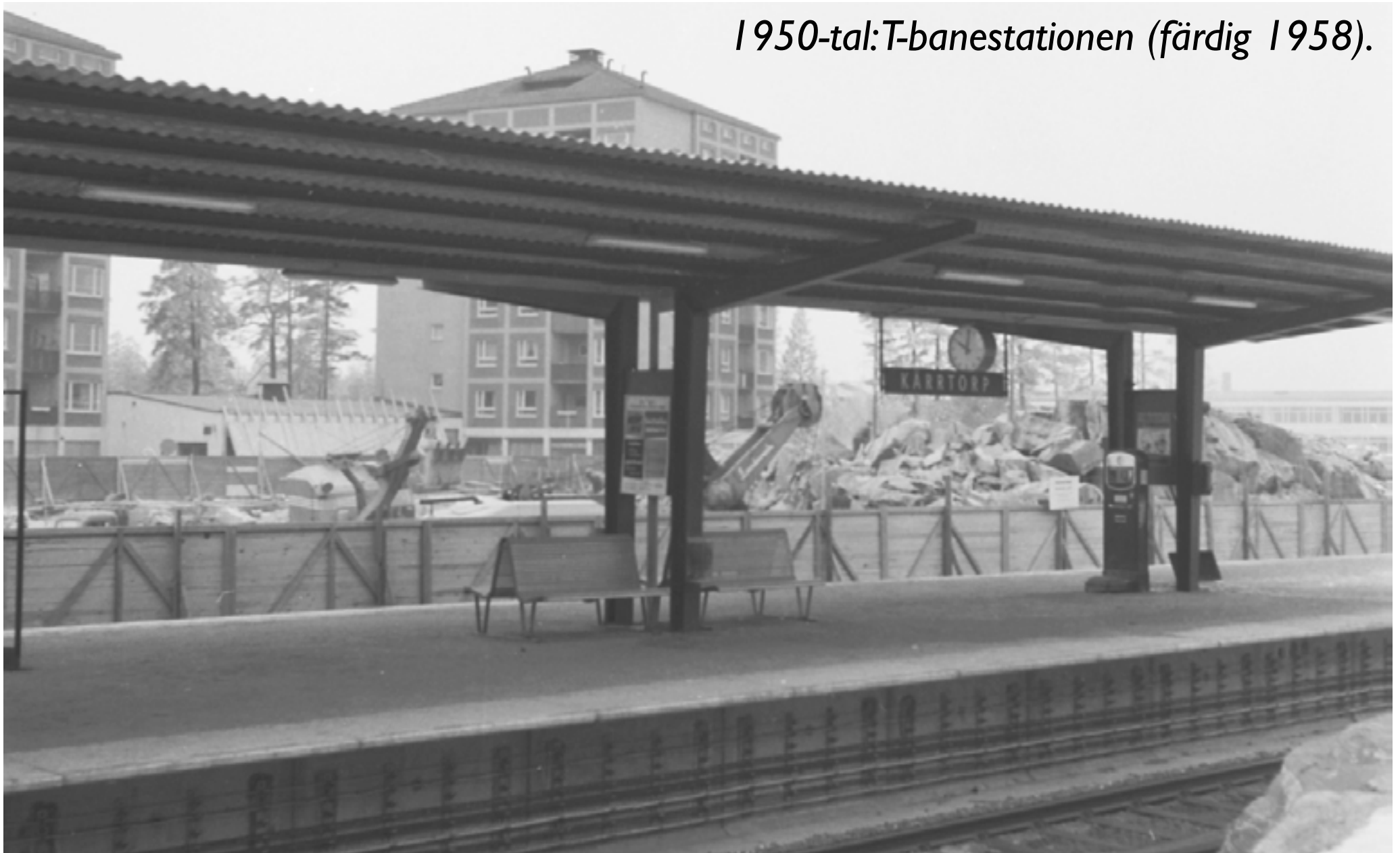
1950-tal: T-banestationen (färdig 1958).