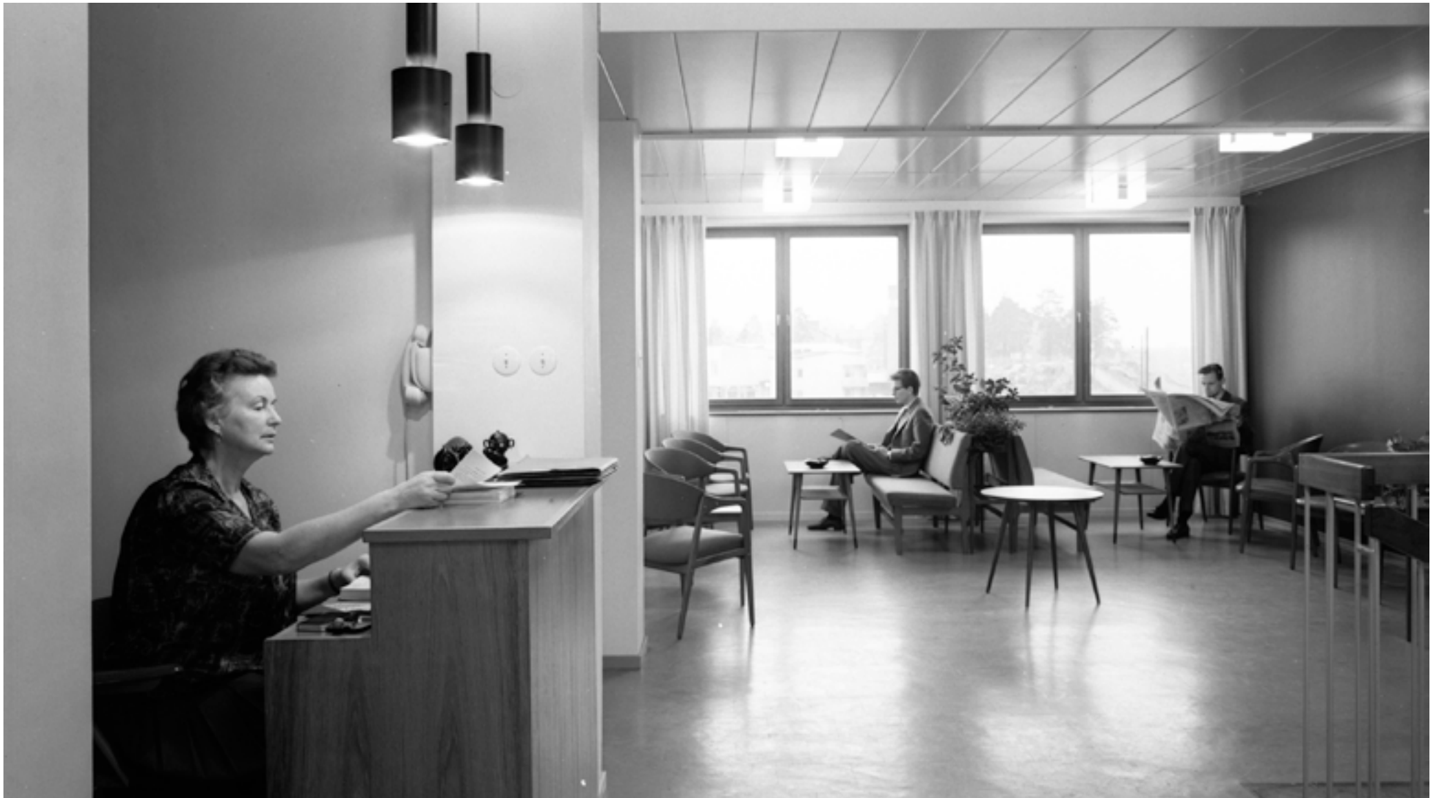
1960: I medborgarhuset Fyren.