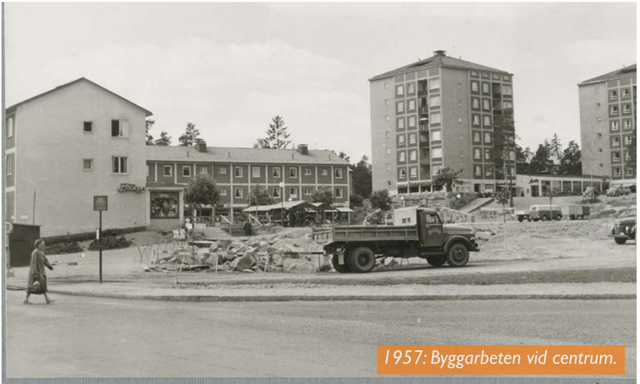
1957: Byggarbeten vid centrum.