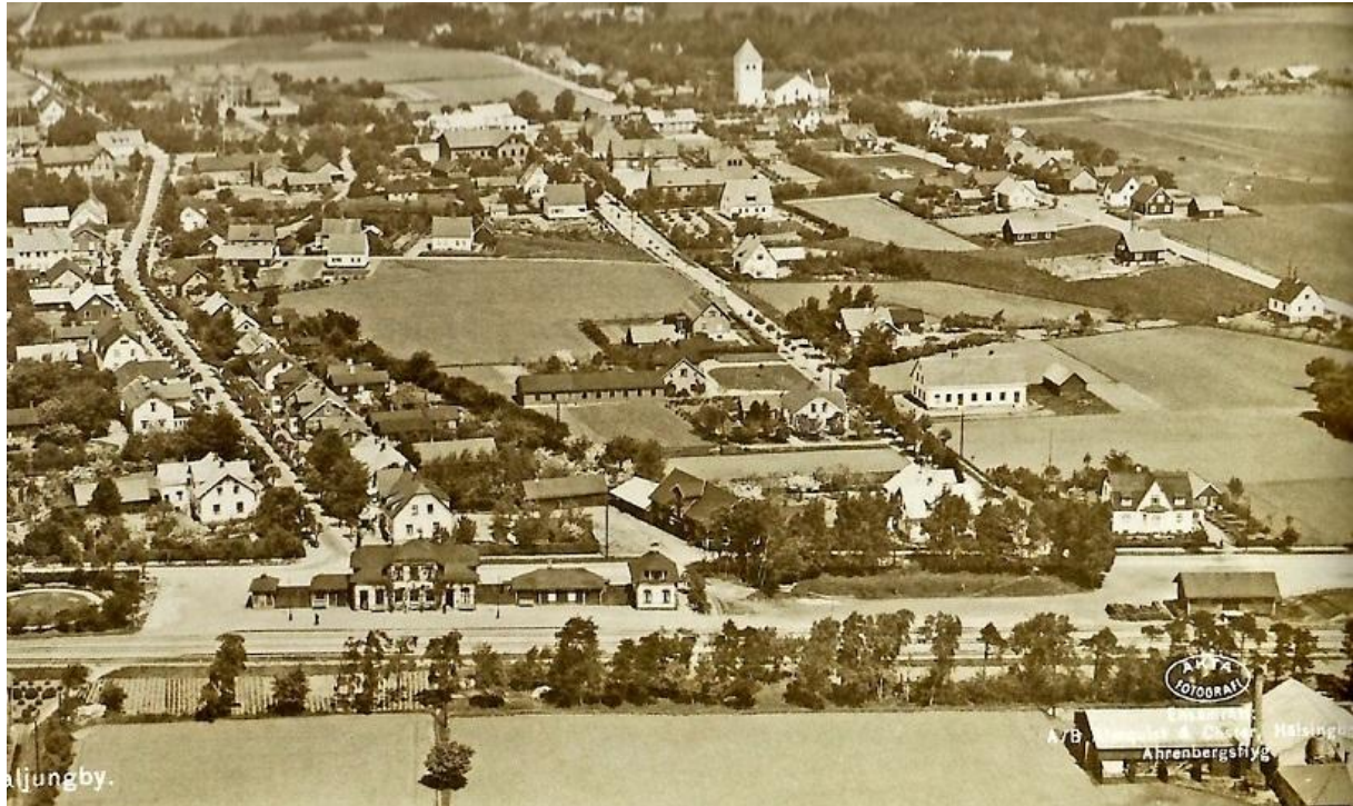
Flygbild från 1930-talet