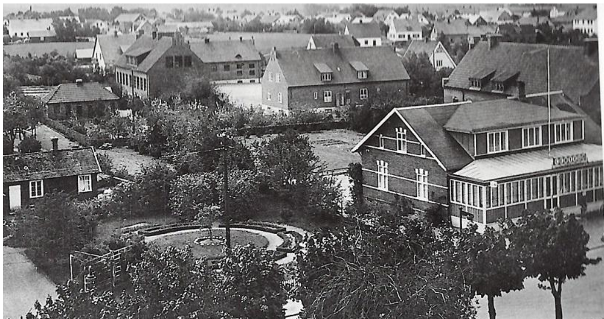
Centrum sett från kyrktornet 1942