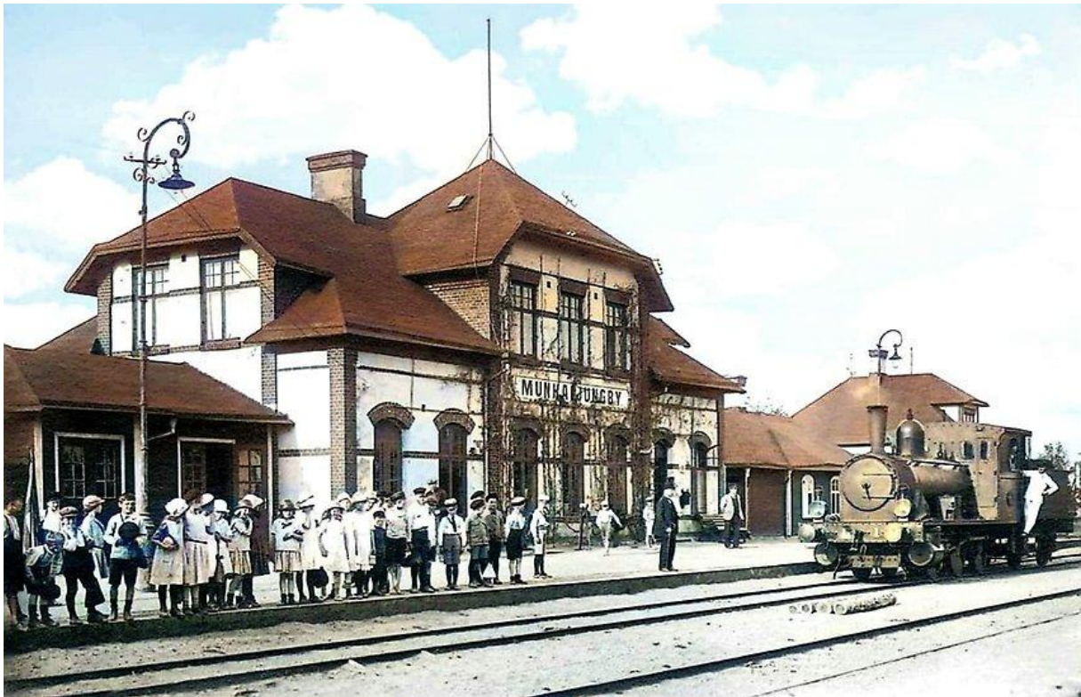
Stationen i april 1910.