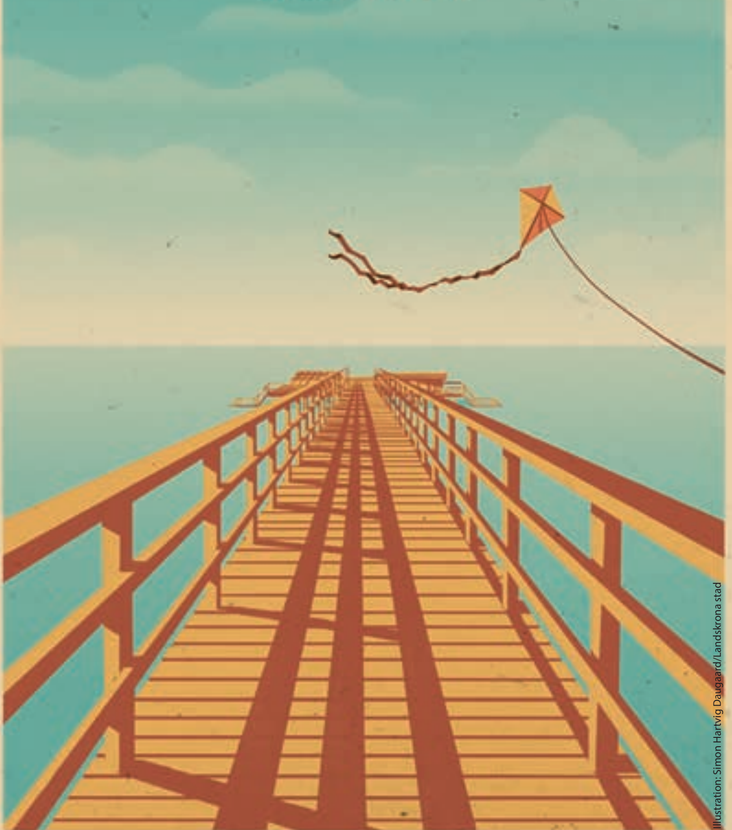
Illustration: Simon Hartvig Daugaard/Landskrona stad