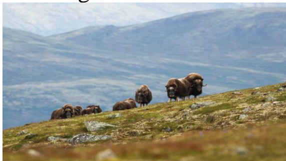
Myskoxar på Dovrefjäll

Buss avgår från Hofors-Storvik-Sandviken-Gävle-Hagsta.