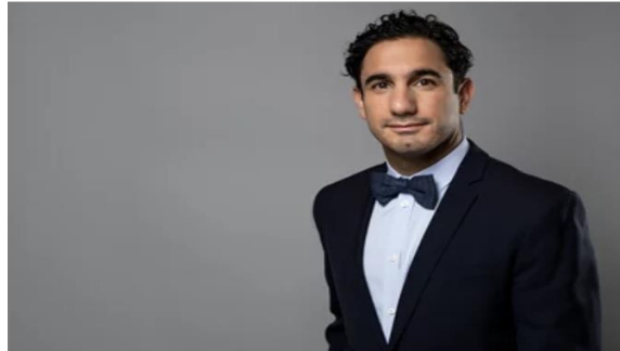
Socialförsäkringsminister Ardalan Shekarabi

Alla tre pensionärsorganisationerna i Sandviken anordnade ett möte för att lyfta pensionsfrågan inför valet. Ardalan Shekarabi, socialförsäkringsminister kom på besök och informerade om pensionsgruppens arbete och socialdemokraternas inställning i pensionsfrågan. Vi fick möjlighet att ställa frågor och fick en del positiva svar.