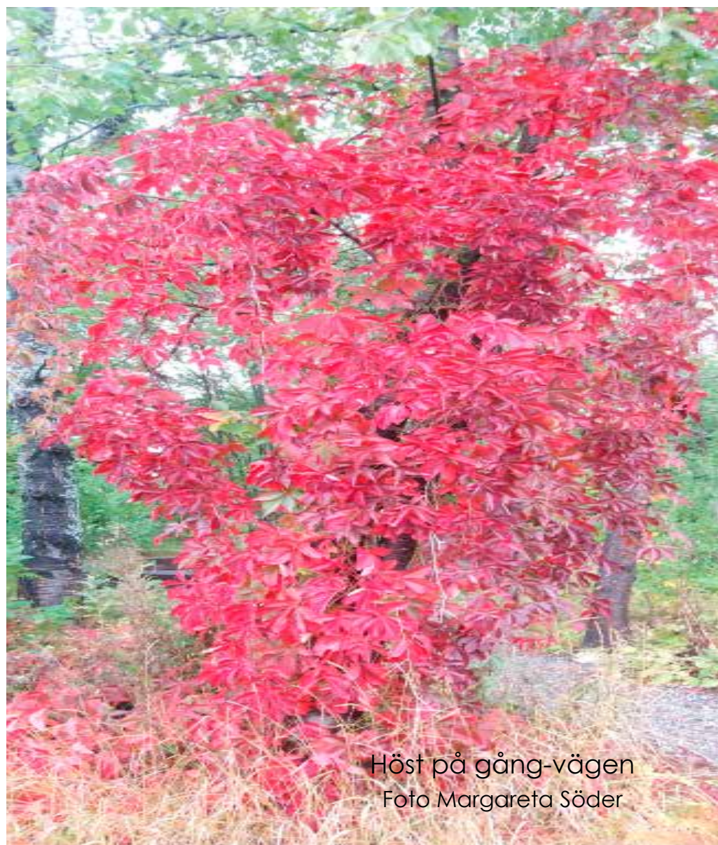
Höst på gång-vägen