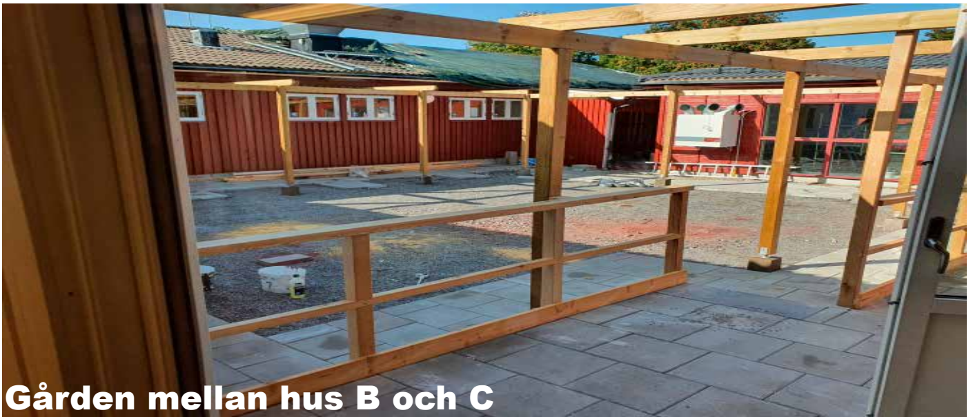
Gården mellan hus B och C