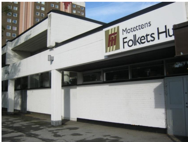
Motettens Folkets Hus, Munkhättegatan 202, Malmö