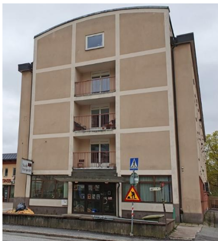
Bilden visar ingången till Studieförbundet

https://www.studieforamjandet.se/stockholms-lan/artikelsida/om-oss/vara-lokaler/torpet-i-finntorp/