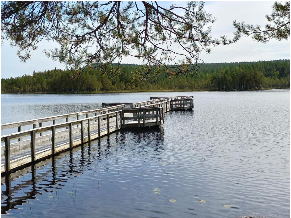
Det är skimmer i molnen och glitter i sjön.

En eftermiddag vid Rävsvenstjärn med ljus och värme i tidig höst för medlemmar ur PRO Hennan. Mötet den sjunde september inleddes med att de medlemmar som så önskade samlades vid Rävsvenstjärn för en avkopplande stund med grillad korv, samt kaffe med kaka. Det viktiga var dock även denna gång att träffas och trivas. Vi möttes av ett stilla vågskvalp och sol som lyste genom en tunn molnslöja. En avkopplande stund som inledning till ett studiebesök av helt annan karaktär.