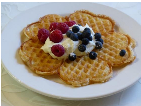
Våffeldagen 25 mars