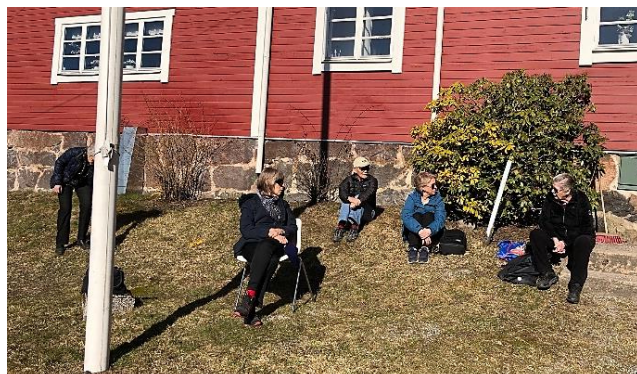
Fikastund på Elgentorp