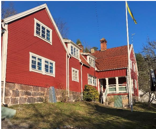
Elgentorp i vårsolen