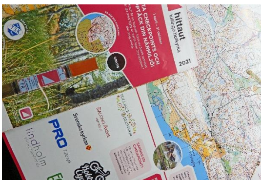
Hittaut Tullinge/Botkyrka – startar 1 april