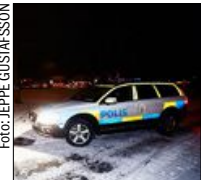
Polis larmades till platsen.