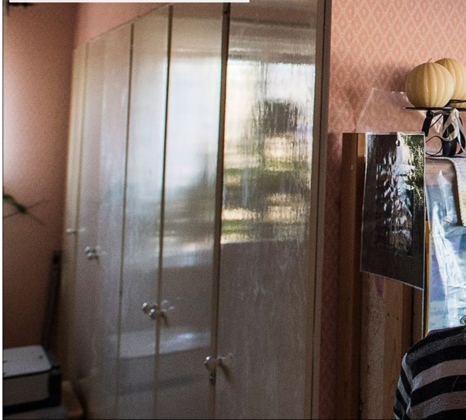
VATTNET RINNER LÅNGS VÄGGARNA "Det började droppa från taket på övervåningen för några år sedan. Sedan dess